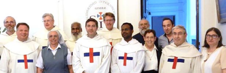
Comité Directivo SIT